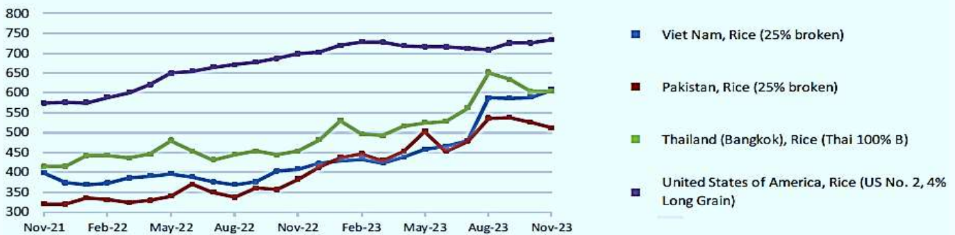
United States dollar per tonne