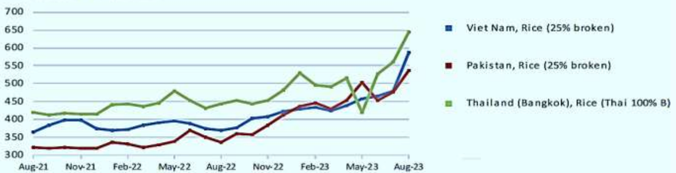
United States dollar per tonne